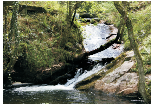
Fervezas de Torrillón