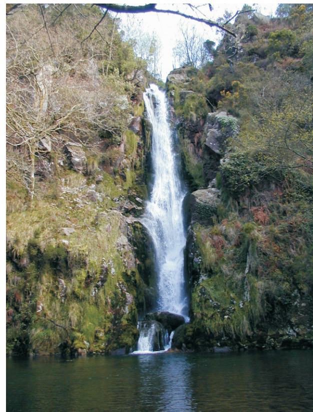
Pozo da Ferida

Tamén se pode facer unha ruta máis lona desde valdao (Valcarría).